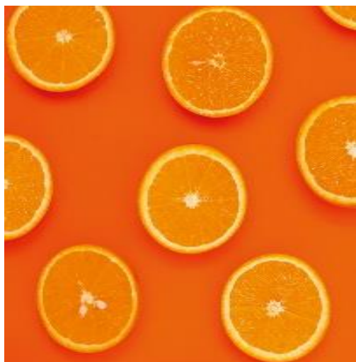
【オレンジインク有り】 よりクリアで鮮やかな発色