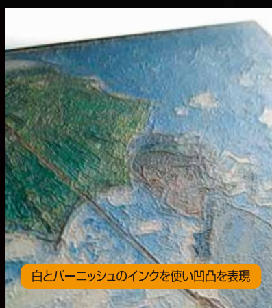
白とバーニッシュのインクを使い凹凸を表現