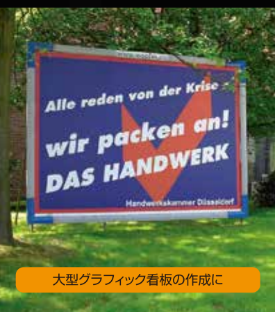
大型グラフィック看板の作成に

最大1250mm×2540mm、厚さ100mm、重量50kg/m 2 のメディアに対応し、千鳥配列にした高性能プリントヘッドが高速作画を実現。生産性を加速します。さらに、用途に合わせてプリントヘッド4基（標準）と6基（オプション）の選択、追加を可能にしました。搭載するMUTOHのLED-UVインクはK,C,M,Yの4色に白+バーニッシュを加えた6色を用意。600x1200dpiの高解像度と最新のUVプリント技術を駆使したPJ-2508UFは、さまざまな用途とメディアへの対応力を提供。プロモーションアイテム、パネル、ショーウィンドウディスプレイ、賞品、ラベル、包装プロトタイプ等、お客様の多様なニーズにお応えするMUTOHのハイパフォーマンスモデルです。