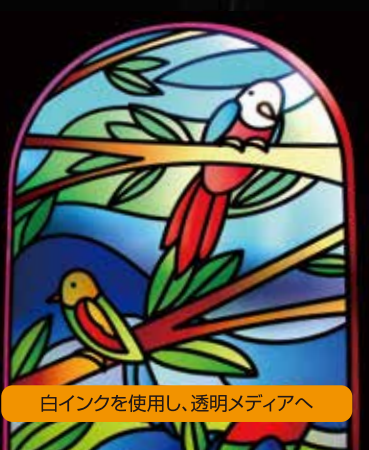
白インクを使用し、透明メディアへ