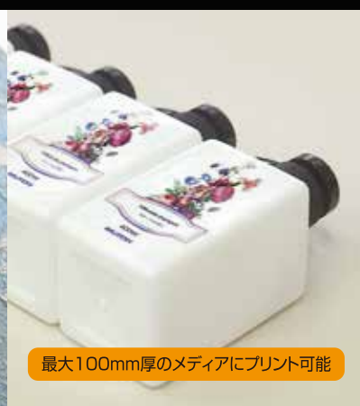
最大100mm厚のメディアにプリント可能