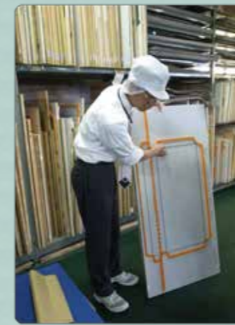
段ボール製造工場