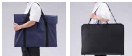
【標準】ソフトケース

軽量で持ち運びに便利なキャリングケース付き。撥水加工を施しているため雨の日も安心です。オプションで、2WAYタイプで持ちやすさ・衝撃に強いハードケースも用意されています。