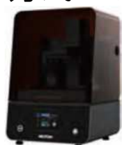
新製品、光造形方式 3Dプリンター「MVL-2100」