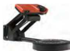
比較的小さなオブジェクトを簡単に3D化。手軽なワイヤレス型オールインワン・3Dスキャナー 「SolPro」