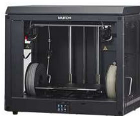
独立式デュアルヘッド搭載。 スタンダードモデル「MF-900」