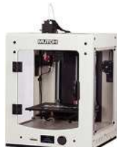
小型・高精度なエントリーモデル 「MF-800」