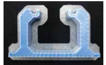
表面(黄色)をPOM、 芯材(赤)をABSで造形する 設定画面

一つの樹脂を使った単体造形だけではなく、デュアルヘッドのメリットを活かした造形が可能。芯材と表面材料を別々の材料にする事が可能です。芯材に安価な材料、表面にエンブラを使用する事で、造形コストを大幅に抑える事ができます。