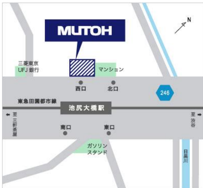
東急田園都市線「池尻大橋」駅 西口出口直結(階段上がり地上部入口)