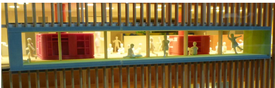
<窓越しから見た 4F保育室>