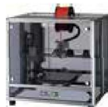
Value3D Magix MF-1000