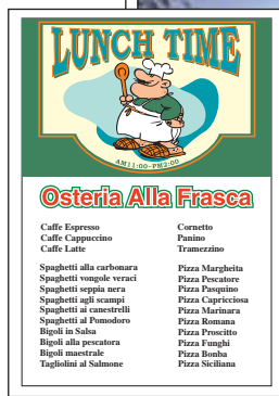
レストランなどの店頭掲示用に