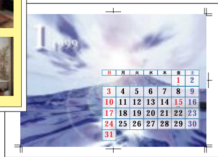
印刷物の仕上がり確認に