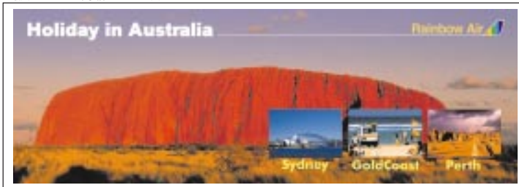
最大934mmの印字幅をいかけた大型ポスターに